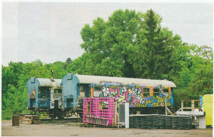
Wagenhallen Ein besonderer Ort, an dem Architekten, Baubotaniker oder Künstler arbeiten. Die Macher des berühmten Puppentheaters Dundu ( dundu.eu ) musizierten gerade und haben uns sofort ins Atelier gelassen.